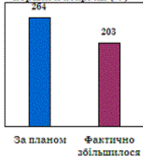
Зростання валової продукції промисловості в першій п'ятирічці (%)