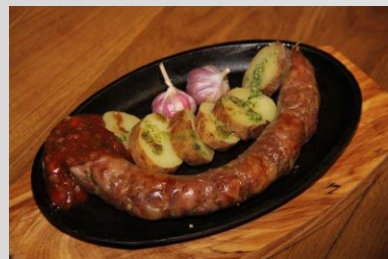
Гурка та крumpлі