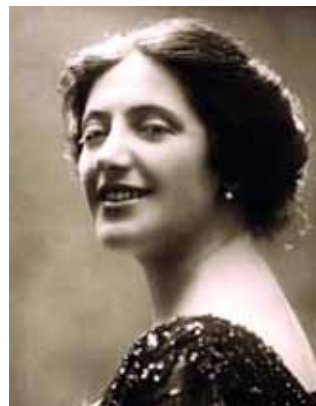
Соломія Крушельницька (1872–1952)

Соломія Крушельницька — видатна українська співачка, яка володіла надзвичайно красивим і виразним голосом. Поряд із класичними аріями, в її репертуарі завжди були українські народні пісні та твори М. Лисенка, С. Людкевича й інших українських композиторів.