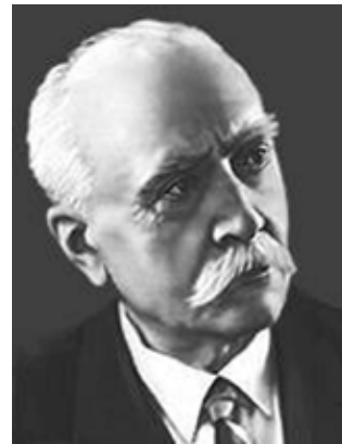
Левко Ревуцький (1889–1977)

Третя частина — святковий фінал, побудований на мелодіях двох українських народних пісень — «А ми просо сіяли» та «Ой на горі мак». Наприкінці фіналу звучить основна тема всієї симфонії та Першої частини — старовинна мелодія «Ой весна, весниця», що несе в собі відчуття свободи і руху вперед, увінчує фінал прославленням життєдайних сил природи і творчої праці.