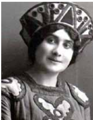
М. Литвиненко-Вольгемут (1892–1966)