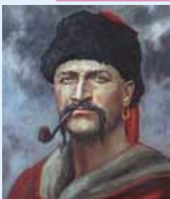
Черкаський полковник Максим Кривоніс

Козацька тематика не є випадковою у творчості М. Лисенка, адже рід Лисенків тягнеться від часів Богдана Хмельницького.