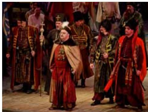
Сцена з опери К. Данькевича «Богдан Хмельницький»