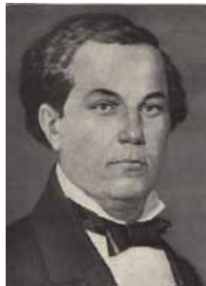
Семен Гулак-Артемовський (1813–1873)

Реалістичне втілення в опері українських народних образів, використання скарбів української народної пісенності й танцювальності визначили оперу С. Гулака-Артемовського як один із найвидатніших творів українського музичного мистецтва. «Запорожець за Дунаєм» і нині залишається однією з найвідоміших українських опер.