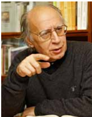
Василь Барвінський (1888–1963)