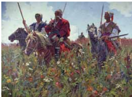
О. Бубнов. Тарас Бульба