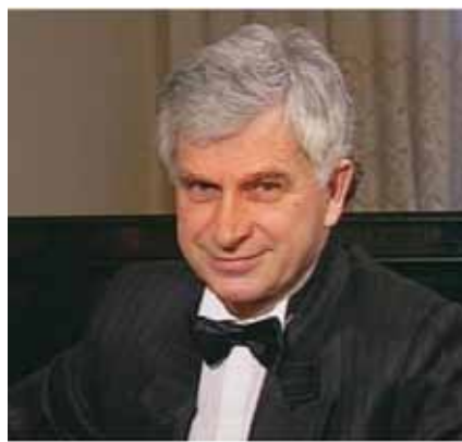
Анатолій Солов'яненко (1932–1999)

Анатолій Солов'яненко — прославлений український співак. Усесвітню славу видатному співакові принесла його концертна діяльність у багатьох країнах світу. Співак виступав на сценах найголовніших театрів Італії, Румунії, США, Німеччини, Канади, Японії, Австралії. Солов'яненко виконував головні ролі в операх «Князь Ігор», «Євгеній Онегін», «Фауст», «Запорожець за Дунаєм».