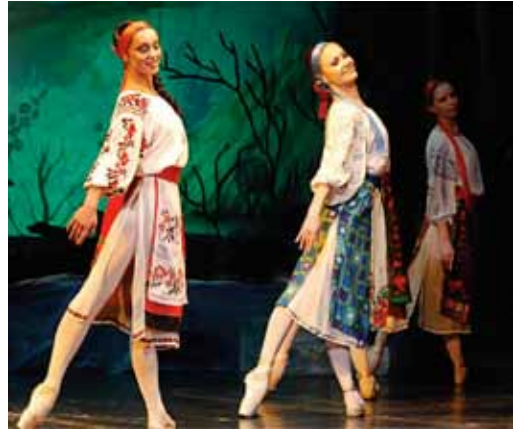
Сцена з балету Є. Станковича «Майська ніч»