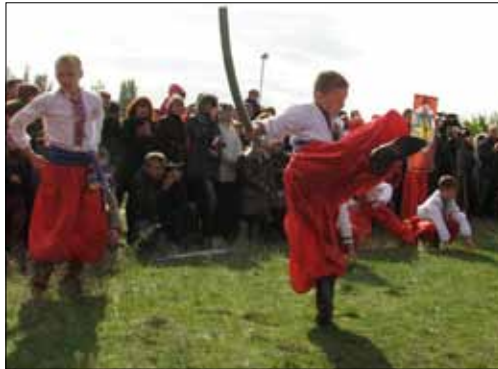
Фестиваль «Покрова на Хортиці»